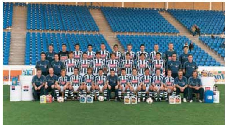
REAL SOCIEDAD DE FUTBOL DE SAN SEBASTIAN (SPANISH 1st LEAGUE) 2002 - 2003